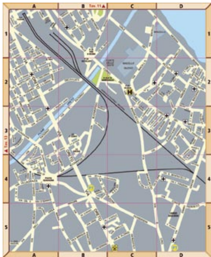
TAVOLA - 14

MILLO Ammiraglio (Via) 90145 9-A1 MINA F. (Via) 90127 14-A2 MINO A. RALLAVICINO (Cortile) 90146 1-B2 MINERNA (Via) 90149 15-B3 MINZONI DON GIOVANNI (Via) 90143 4-C4 MIRABELLA (Via) 90146 1-B4 MIRAGLIA A. (Via) 90124 14-B6 MIRAGLIA M. (Via) 90139 7-C4 MISSORI COLONNELLO (Via) 90123 14-C3 MOGIA (Via) 90138 9-C3