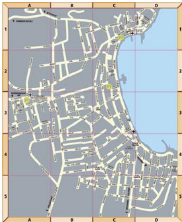
TAVOLA - 15

MUZIO (Vicolo) 90134 10-C5 MUZIO S. R. (Via) 90139 7-B4