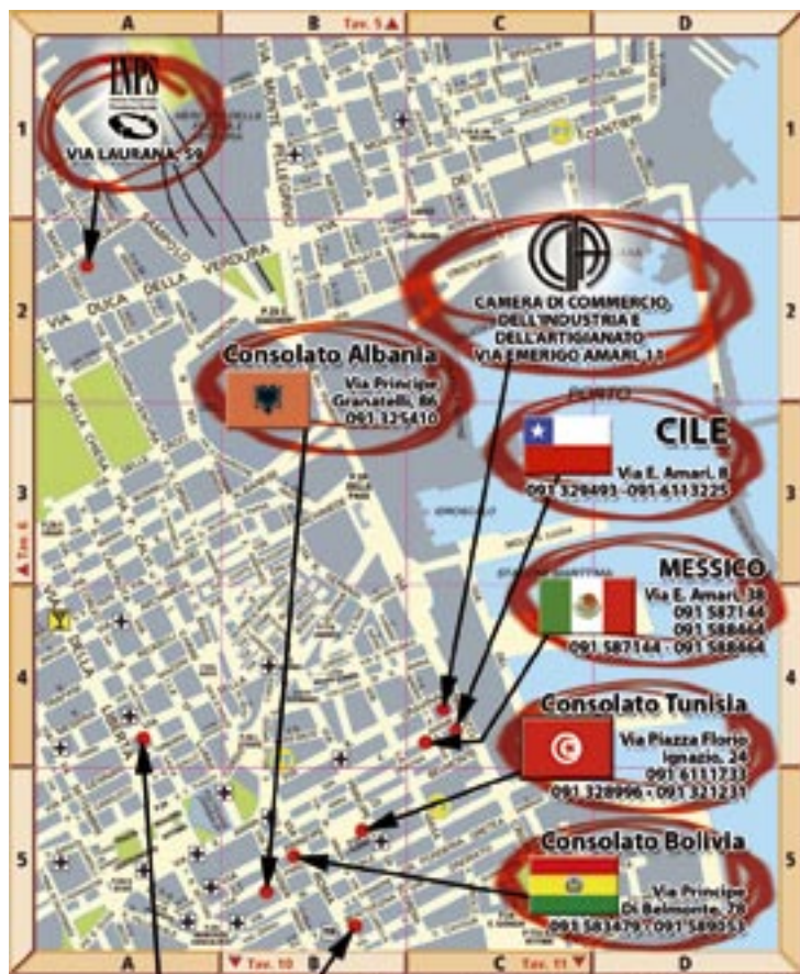
TAVOLA - 7