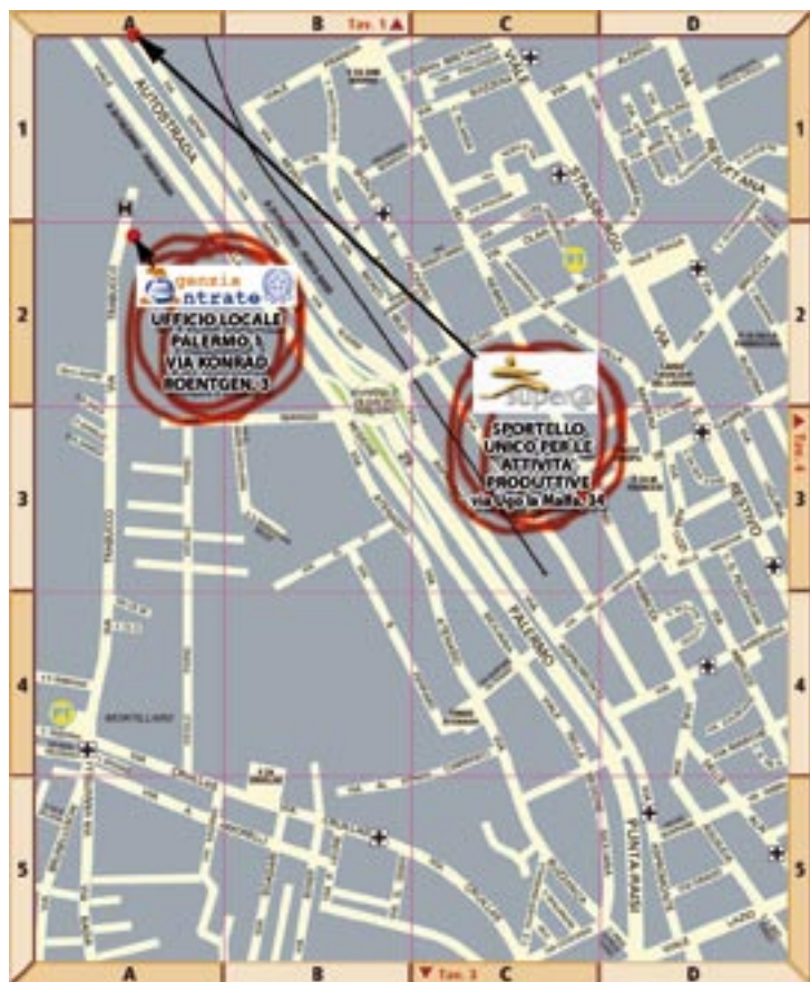
TAVOLA - 2