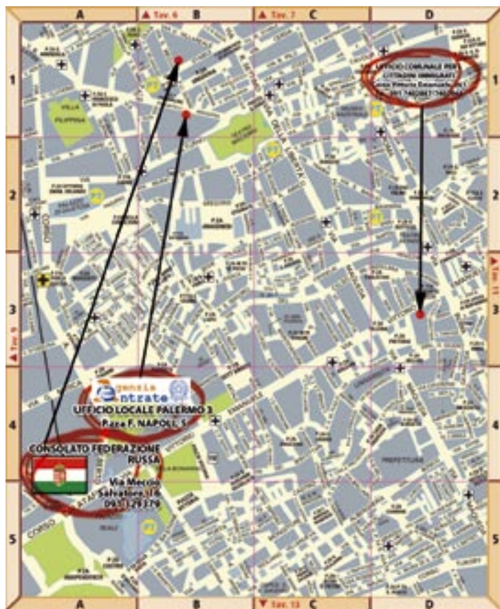
TAVOLA - 10